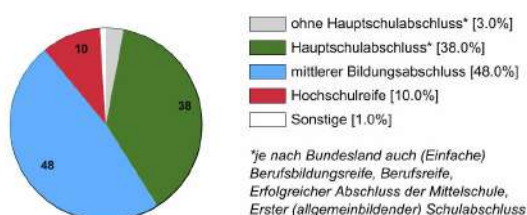
Ausbildungsbereich Industrie und Handel