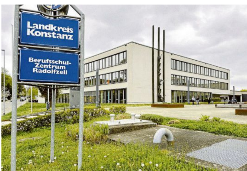
Am Berufsschulzentrum in Radolfzell sind neue Prüfungsflächen für Landschaftsgärtnerinnen und -gärtner geschaffen worden.

Allgemein habe sich der Antiquitätenmarkt stark verändert. „Junge Menschen sammeln heute andere Dinge“, so Geble. Vor allem der Bereich Möbel und Porzellan habe seine Hochzeiten längst hinter sich. Früher habe man für eine Sonderanfertigung einer Kanne aus Meissener-Porzellan teils 50.000-Euro-Gebote bekommen, jetzt würde man bei 1500 Euro starten. Umso spannender sei es, neue Kunstbereiche zu entdecken. Was die Bettelschale am 18. April erzielen wird, wird Geble mit großem Interesse verfolgen.