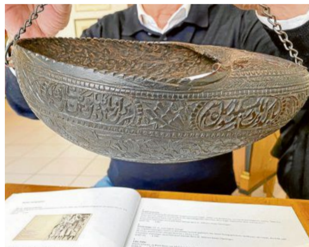
Die Bettelschale des islamischen Sufi-Ordens ist eines der außergewöhnlichen Stücke der kommenden Auktion im Auktionshaus Geble in Radolfzell. Schon vor dem Auktionstermin wurde im Internet auf dieses Stück geboten.